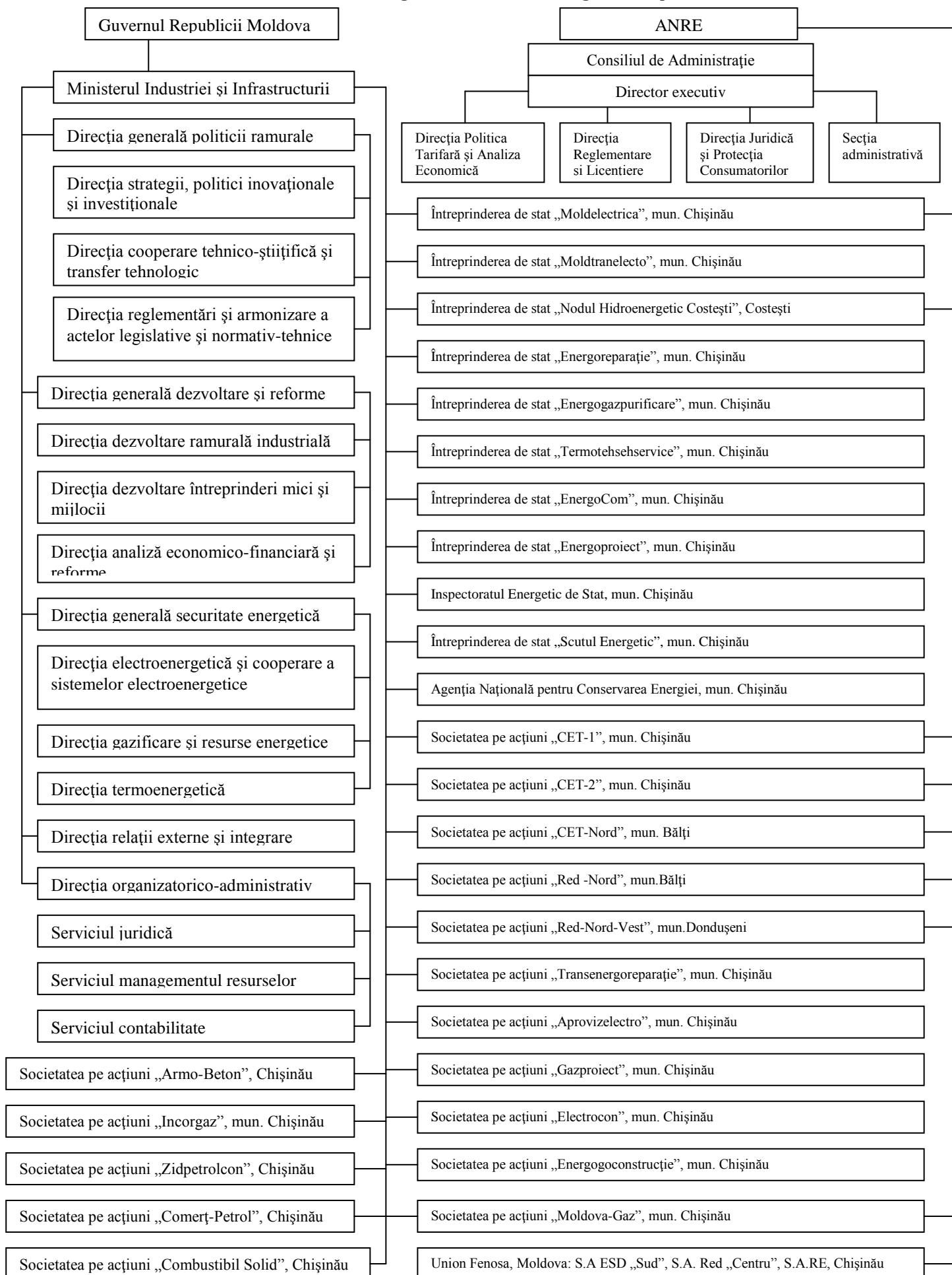
Schema 1: Structura managerială a sectorului energetic al Republicii Moldova