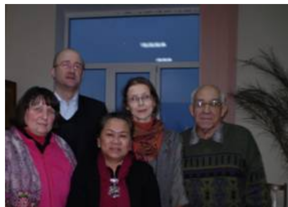
Reprezentanți ai grupului de lucru